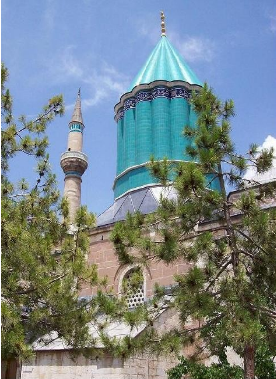
Mevlana Müzesi, Konya

Selçukluların tek başkenti bahçeleri ve nehirleriyle orta anadolu bozkırlarının vadisi gibi görünüyor. Konya'da çokça Selçuklu Türbeleri görülebiliyor. Türbelerin en büyüğü ise "Gel, kim olursan ol, yine gel" diyen tarikat kurucusu Mevlana'nın. Aynı zamanda bu türbe Konyanın simgesi. Mevlana'nın babası Bahaeddin Veled vefatında kendi isteği üzerine Alaaddin Keykubat'ın şehrin dışındaki gülbahçesine defnedildi. Mevlana'da sonra babasının yanına defnedildi.